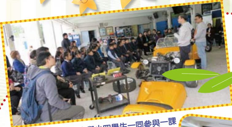
來賓與小四學生一同參與一課STEM汽車工程師課程