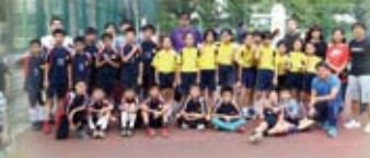
西貢區小學校際足球比賽