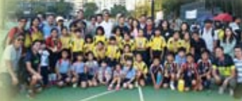
東華三院小學聯校足球同樂日