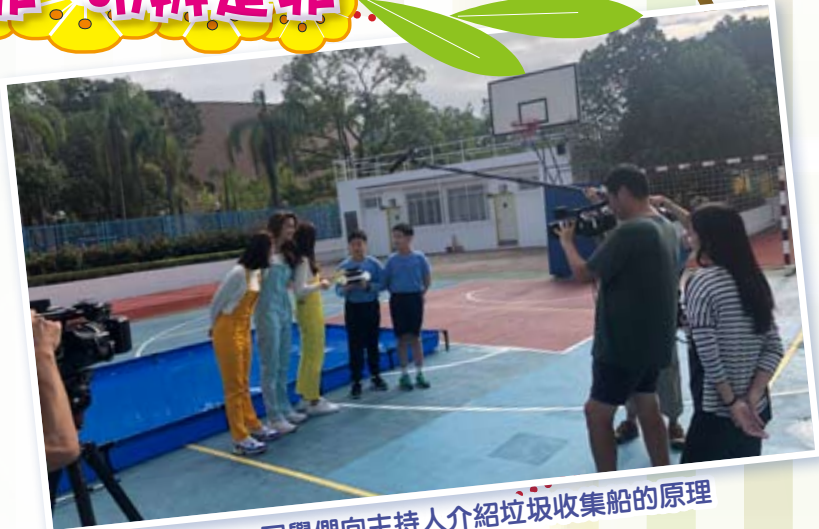
同學們向主持人介紹垃圾收集船的原理