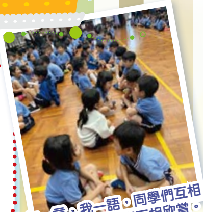
你一言、我一語，同學們互相說出大家的長處和互相欣賞。

我們也會透過周會向學生帶來正向教育的訊息，讓學生知道自己的性格強項，從而加以發展。更會在小息時，增設遊戲區，讓學生透過遊戲學懂與人相處之道，明白與人合作的技巧，亦可藉此增加學生的快樂感。本校提供多元化的活動，學生可因應個人的喜好而參與，在不同的活動及比賽中，學生可發展自己的潛能，追求卓越並為自己帶來滿足感。