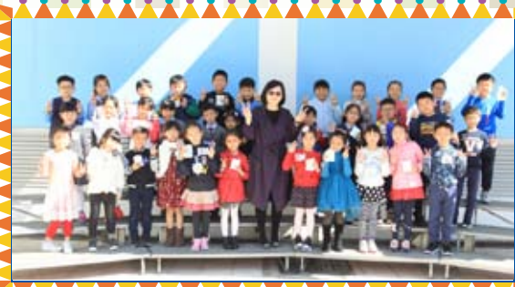
劉校長和12月生日的同學合照