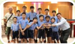
馬錦明慈善基金馬陳端喜紀念中學 「第五屆小學五人籃球挑戰賽」