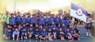
西貢區小學校際田徑比賽