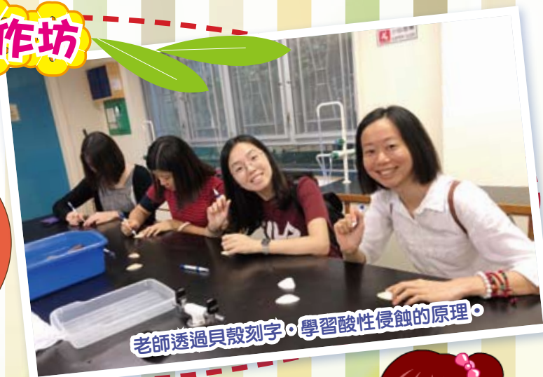
老師透過貝殼刻字，學習酸性侵蝕的原理。

全體老師於8月30日到西貢崇真天主教中學，讓老師體驗不同學校的校本STEM課程。