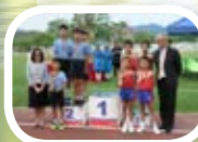
匯知中學第十六屆陸運會 小學組4x100米接力邀請賽