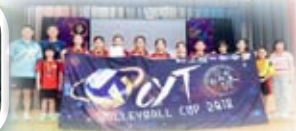
順德聯誼總會鄭裕彤中學 鄭裕彤盃排球賽