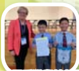
第70屆香港學校朗誦節 Choral Speaking Primary 1 to 3 Boys