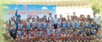
東華三院小學聯校運動會