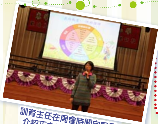
訓育主任在周會時間向同學介紹正向教育的性格強項

我們也會透過周會向學生帶來正向教育的訊息，讓學生知道自己的性格強項，從而加以發展。更會在小息時，增設遊戲區，讓學生透過遊戲學懂與人相處之道，明白與人合作的技巧，亦可藉此增加學生的快樂感。本校提供多元化的活動，學生可因應個人的喜好而參與，在不同的活動及比賽中，學生可發展自己的潛能，追求卓越並為自己帶來滿足感。