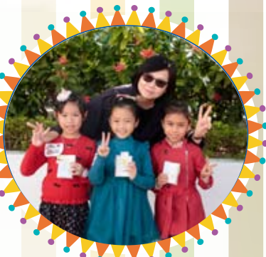
Happy Birthday! Have a great day!