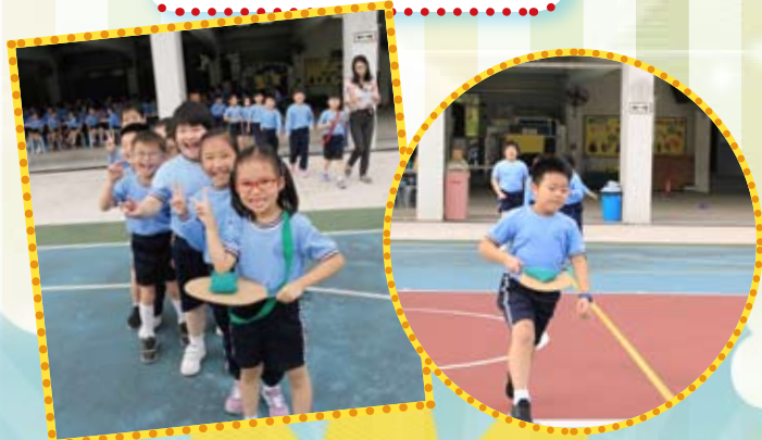
每個同學都有份參與，玩得很投入呢！

最重要的是有系統地協助學生培養「成長型思維」，讓學生樂於學習、勇於挑戰，面對困難會迎難而上，能夠從批評中學習，願意接受高難度的任務，透過老師正面而有效的回饋，讓學生知道做得好的原因是因為個人的努力、盡責、投入，並掌握需要改善的地方。